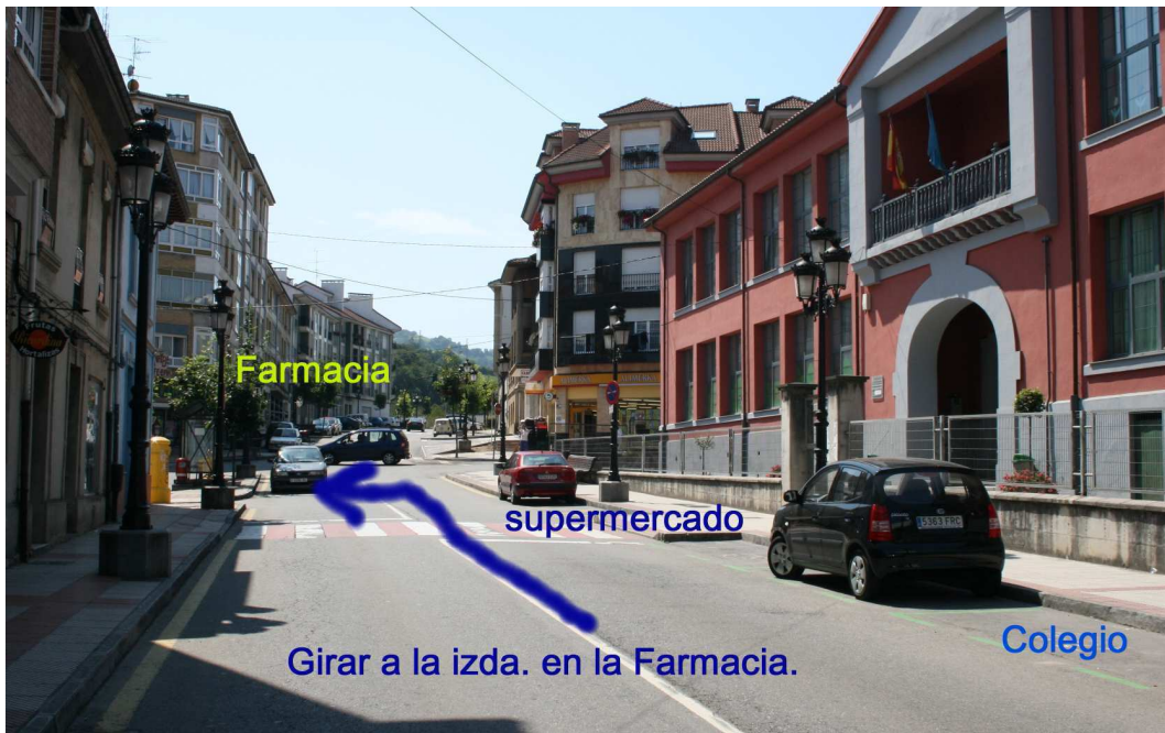
Girar a la izda. en la Farmacia.