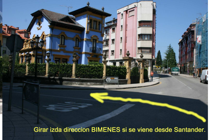
Girar izda direccion BIMENES si se viene desde Santander.