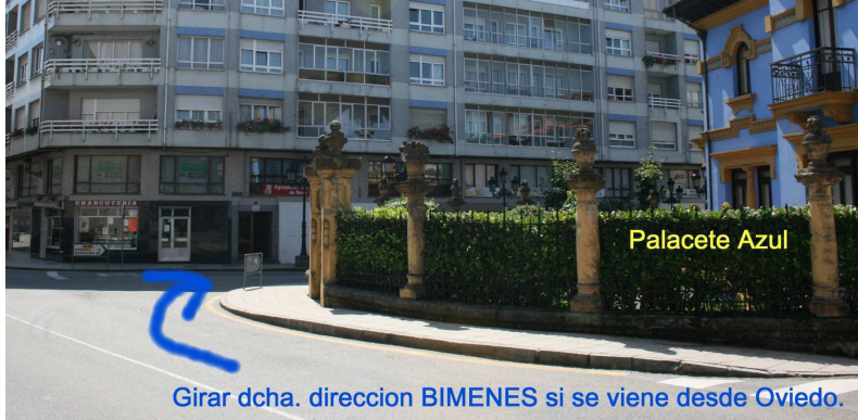
Girar dcha. direccion BIMENES si se viene desde Oviedo.

Como llegar al Hotel Rural Fuensanta desde Nava: Una vez en Nava, buscar el cruce a Bimenes. (Palacete azul).